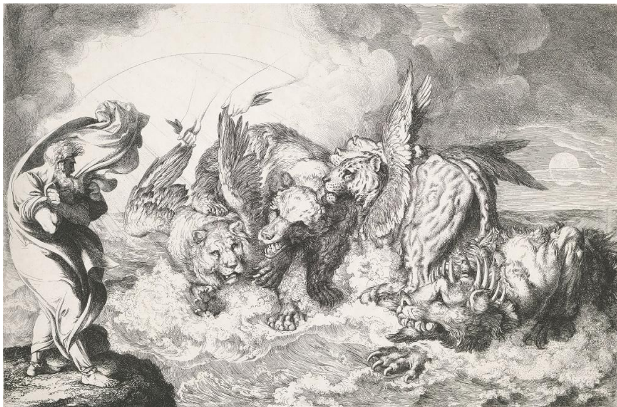
Artist: Luigi Sabatelli 1809. Rijksmuseum.nl